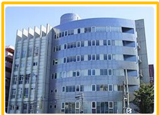
社会福祉法人 向陽会 ひまわり病院 鹿児島市上之園町20番28号